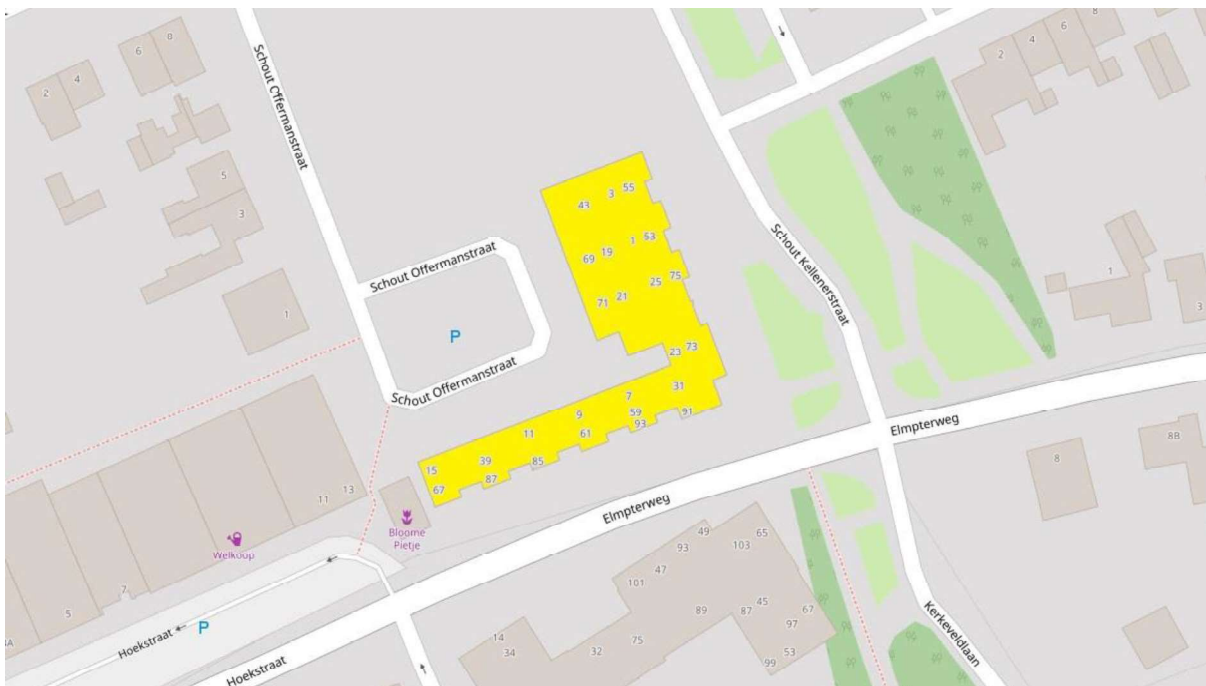
Figuur 1. Locatie van het plangebied (geel weergegeven).